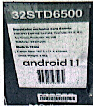
Imagen referencial del TAG recortado

Copia impresa del TICKET o código alfanumérico que le salió al terminar su registro y que es enviado al correo electrónico registrado para participar en la promoción empresarial.